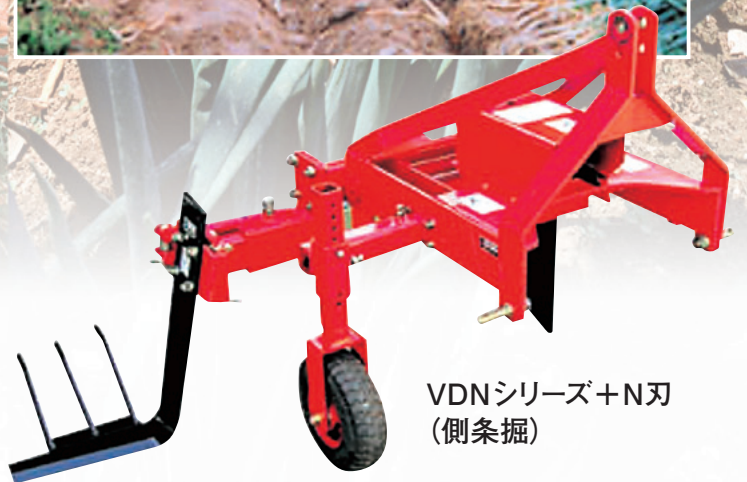
VDNシリーズ+N刃 (側条掘)