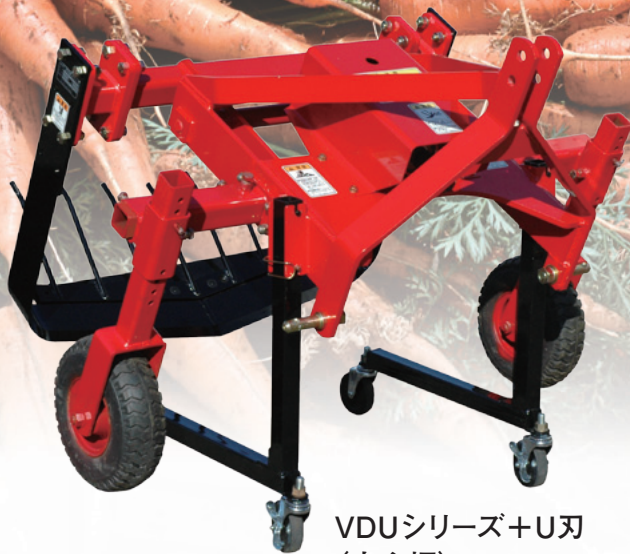
VDUシリーズ+U刃 (中心掘)